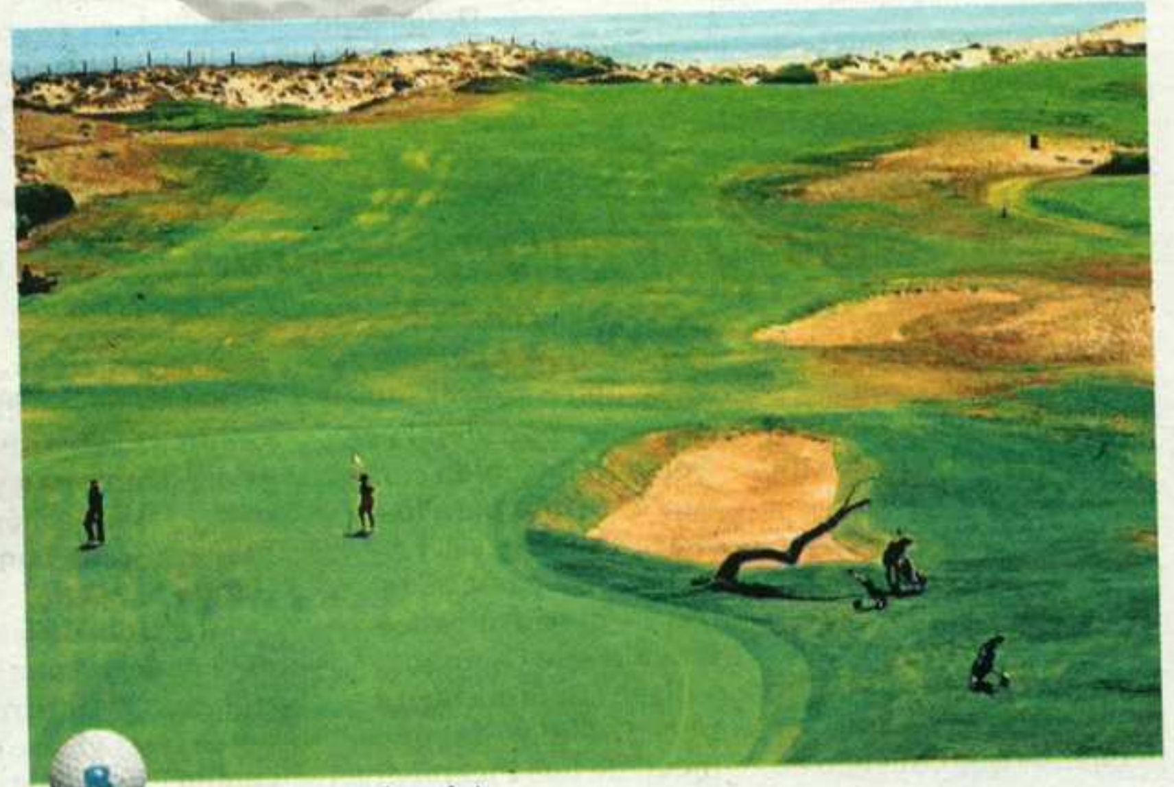
Las Colinas Golf & C. C. (Orihuela Costa, Alicante)