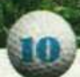
Villaitana (Benidorm, Alicante)