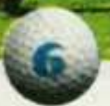
Escorpión (Bétera, Valencia)

campeones que han pasado por las instalaciones de El Bosque (6.249 m.), una de las piezas que Robert Trent Jones ha dejado en España. La ondulación de sus calles y su amplitud ha permitido disfrutar a todo tipo de jugadores. Entre los pros, Vijay Singh y Olazábal pusieron su sello en los noventa.