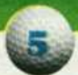
La Sella (Denia, Alicante)