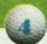
Oliva Nova (Oliva, Valencia)