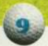
Font del Llop (Monforte del Cid, Alicante)