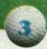
El Bosque (Chiva, Valencia)